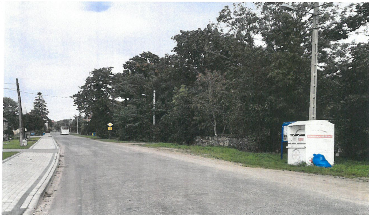
Mikołajowice obok nr 53 – kierunek Księginice