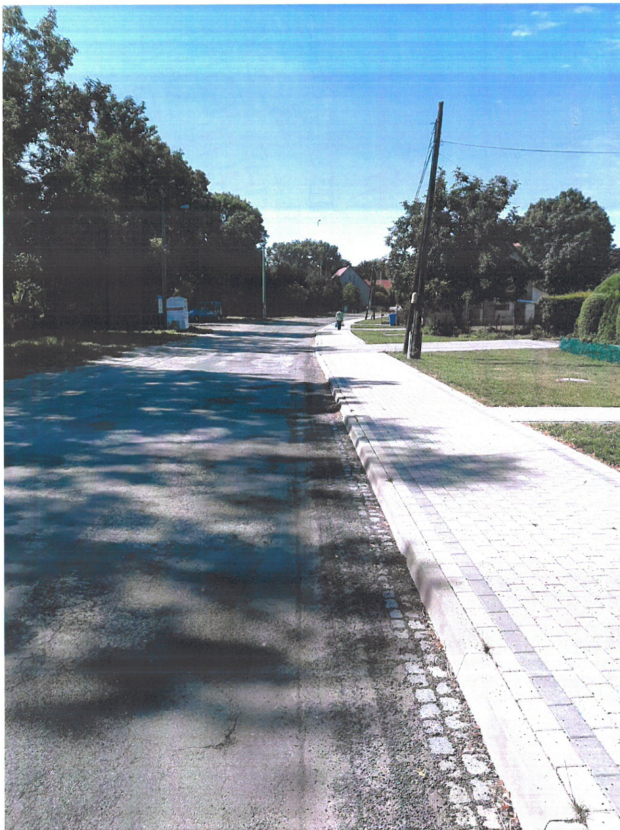
Mikolajowice obok nr 4 i 5 – kierunek Ogonowice