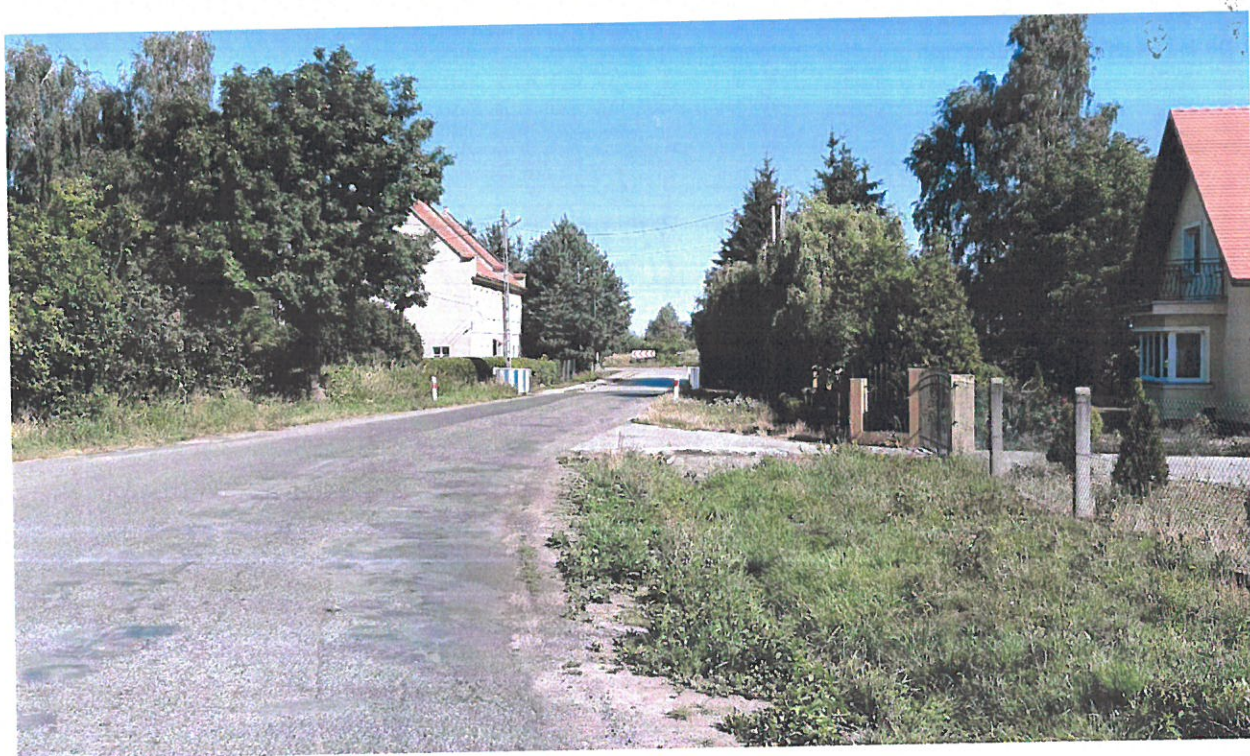
Raczkowa obok 49- kierunek Nowa Wieś Legnicka