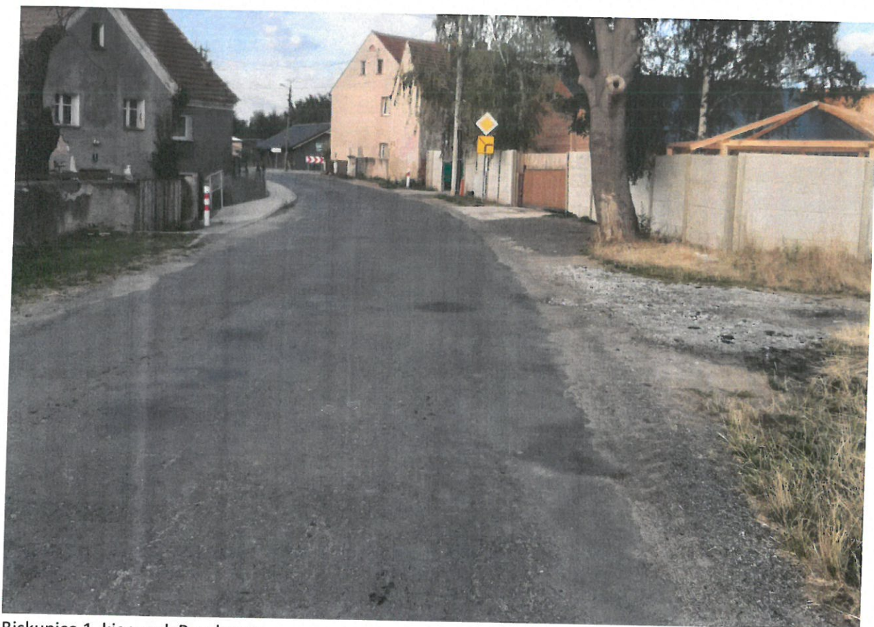
Biskupice 1 kierunek Raczkowa