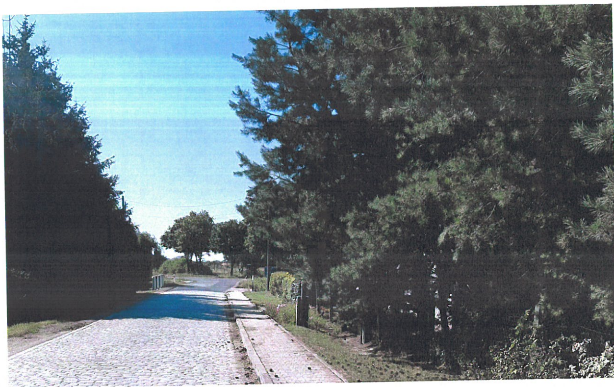
Raczkowa 46- kierunek Biskupice