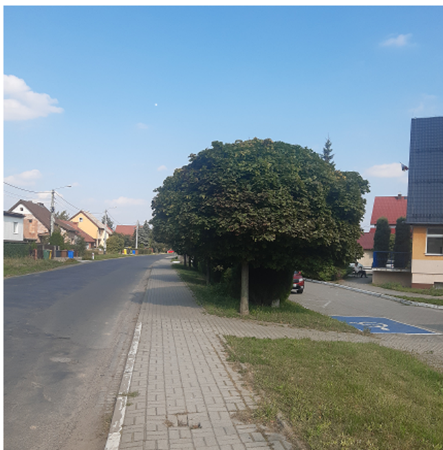
ul. Klasztorna – Kierunek Księginice