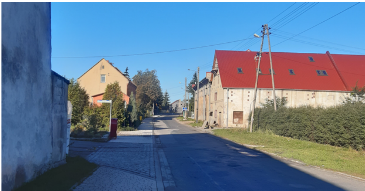
Księginice – kierunek Legnickie Pole