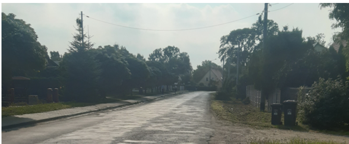
ul. Klasztorna - Kierunek Legnickie Pole Centrum – Gniewomierz