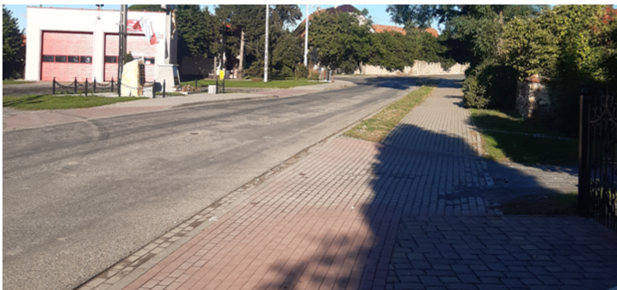
OSP Taczalin - kierunek Koskowice