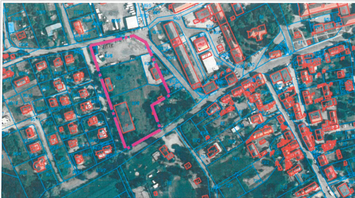
Rys. 1 Położenie obszaru opracowania zmiany planu miejscowego.